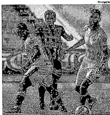
Moto Club empatou por 1 x 1 com o Imperatriz no fim de semana

O Sampaio volta a campo na sexta-feira, 9, para enfrentar o Vasco, às 19h, em São Luís (RN). ■