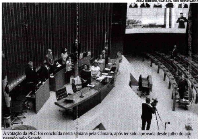
A votação da PEC foi concluída nesta semana pela Câmara, após ter sido aprovada desde julho do ano passado pelo Senado

FUNDO PARTIDÁRIO A promulgação vai incluir na Constituição um parágrafo determinando que "o montante do fundo de financiamento de campanha e da parcela do fundo