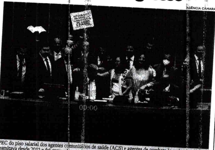
PEC do piso salarial dos agentes comunitários de saúde (ACS) e agentes de combate às endemias (ACE) tramitava desde 2011 e foi aprovada nesta semana, na Câmara

Parlamentares do Maranhão comemoraram a aprovação da Proposta de Emenda à Constituição (PEC) 22/11, que fixa piso salarial nacional de dois salários-mínimos (R$ 2.424,00) a ser bancado pela União, aos agentes comunitários de saúde (ACS) e agentes de combate às endemias (ACE).