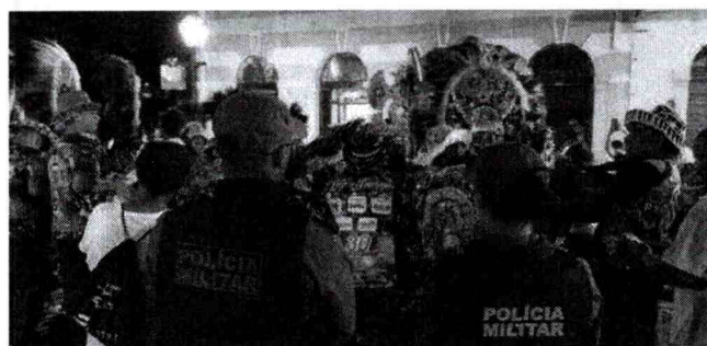
Equipes militares serão reforçadas no Centro Histórico de São Luís, onde haverá um grande arraial e vários pontos de festejo