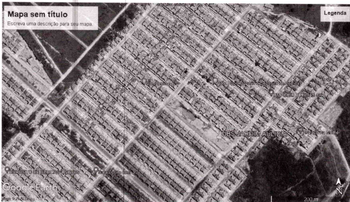
Imagem 02: Local da construção