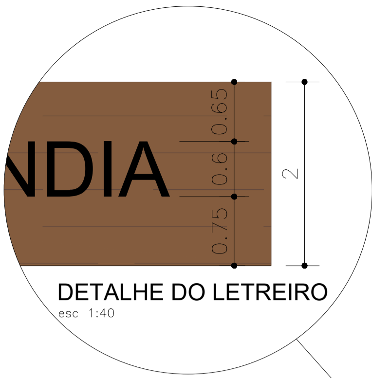
DETALHE DO LETREIRO esc 1:40