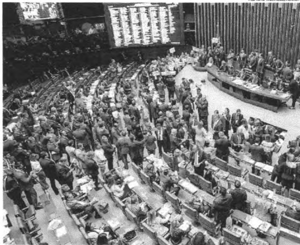
Reforma Tributária não avançou no Congresso e ainda há outras propostas que tramitam no Senado Federal

A pauta prioritária inclui ainda outros temas econômicos, como a reforma administrativa que o governo federal deve enviar ao Congresso em fevereiro. O pacto federativo também deve