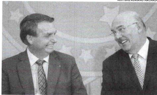
MPF encontra indício de interferência de Bolsonaro nas investigações sobre corrupção no MEC

MÁRCIO FALCÃO e FERNANDA VIVAS TV GLOBO/BRASÍLIA