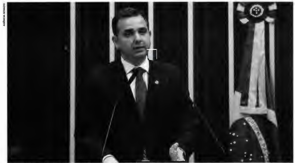
O presidente do Senado, Rodrigo Pacheco, afirmou que o Congresso Nacional não aceitará retrocessos democráticos