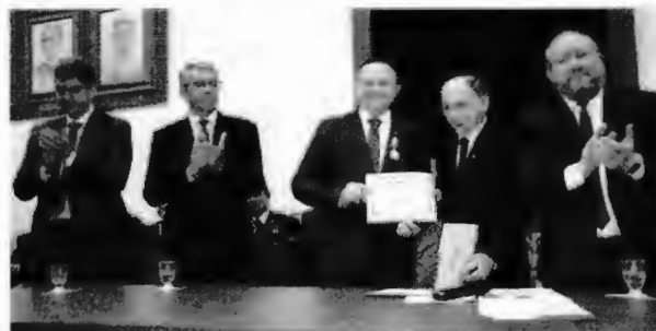
O governador Carlos Brandão recebe condecoração durante solenidade realizada na Academia Maranhense de Letras