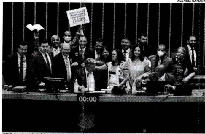
PEC do piso salarial dos agentes comunitários de saúde (ACS) e agentes de combate às endemias (ACE) tramitava desde 2011 e foi aprovada nesta semana, na Câmara

Parlamentares do Maranhão comemoraram a aprovação da Proposta de Emenda à Constituição (PEC) 22/11, que fixa piso salarial nacional de dois salários-mínimos (R$ 2.424,00) a ser bancado pela União, aos agentes comunitários de saúde (ACS) e agentes de combate às endemias (ACE).