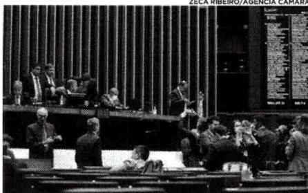
Projeto que permite o ensino domiciliar foi aprovado pelo Plenário da Câmara dos Deputados, mas falta ser apreciado pelo Senado

Após de debates acirrados por dois dias e divergências entre bancadas partidárias, o Plenário da Câmara dos Deputados concluiu nesta quinta-feira (19) a votação do Projeto de Lei 3179/2012, que regulamenta a prática da educação domiciliar no Brasil. A chamada "Homeschooling" prevê a obrigação do poder público de zelar pelo adequado desenvolvimento da aprendizagem do estudante. O projeto seguiu para análise do Senado.