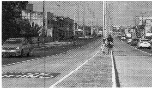
A obra na Estrada do Araçagi, que foi iniciada no ano de 2019, deveria ter sido entregue no ano passado

"Como os transtornos causados pelo seu grande porte e impacto social. Além disso, foram identificadas inconformidades e interferências ao longo da execução dos serviços, a exemplo da existência de ligações clandestinas de água e esgoto, fatos que fizeram com que fossem necessárias mudanças e adequações, junto ao alto índice pluviométrico dos últimos anos, que dificultaram ainda mais o andamento da obra", esclare-