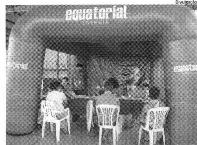
Cadastro ocorrerá até 29 deste mês, no Conjunto Malóbb

A empresa ressalta ainda que todas as recomendações de higiene e segurança serão seguidas, portanto, os clientes deverão fazer o uso de máscara.