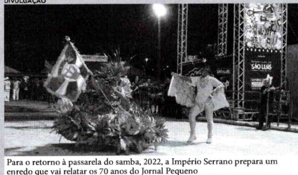
Para o retorno à passarela do samba, 2022, a Império Serrano prepara um enredo que vai relatar os 70 anos do Jornal Pequeno

Cotação - Comercial C. R$ 5,624 V. R$ 5,625 - Turismo C. R$ 5,640 | V. R$ 5,787 - Euro C. R$ 6,585 V. R$ 6,587 Libra C. R$ 7,462 | V. R$ 7,464 - Postagem 0,5000% Maré - 1º Baixamar - 1:56-0:2 m | 1º Preamar - 8:00 6,4 m | 2º Baixamar - 14:15 0,1 m | 2º Preamar - 20:13 6,4 m | Loteria - Quinta - 5693 (28/10/21) - 06-41-67-69-70 | Lotofácil - 2359 (28/10/21) - 03-04-05-06-07-12-14-15-17-19-20-21-22-23-24 | Timemania - 1706 (28/10/21) - GSA/AL - 16-23-37-42-49-63-77 | Dupla Sena - 2291 (28/10/21) - 1º sorteio 03-12-23-25-33-49 | 2º sorteio 07-10-23-28-32-44 Dia de Sorte - 524 (28/10/2021) Agosto - 04-07-14-17-19-21-29 |