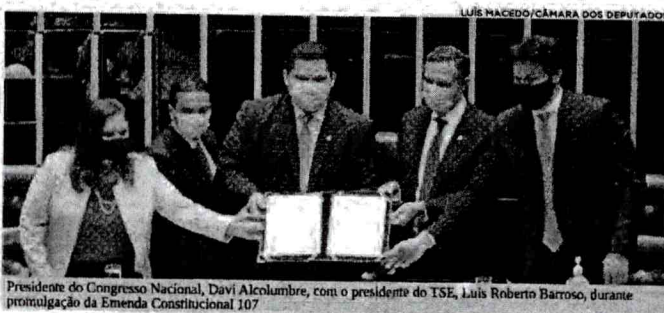
Presidente do Congresso Nacional, Davi Alcolumbre, com o presidente do TSE, Luis Roberto Barroso, durante a promulgação da Emenda Constitucional 107

"Deputados e senadores compreenderam essa manifestação dos profissionais de saúde e da ciência que, preocupados com a pandemia do coronavírus, viam as eleições no dia 4 de outubro como um risco para a vida dos brasileiros. Acho que essa decisão ficará para a história deste país como uma decisão com base na responsabilidade", destacou. A decisão de postergar o pleito municipal por 42 dias, segundo ele, vai permitir que o TSE tenha mais tempo para se adaptar a uma votação em tempos de pandemia. Organizar o dia da eleição em uma crise histórica de saúde pública não é tarefa fácil. Os 42 dias de adiamento dessas eleições municipais serão fundamentais para que o Tribunal Superior