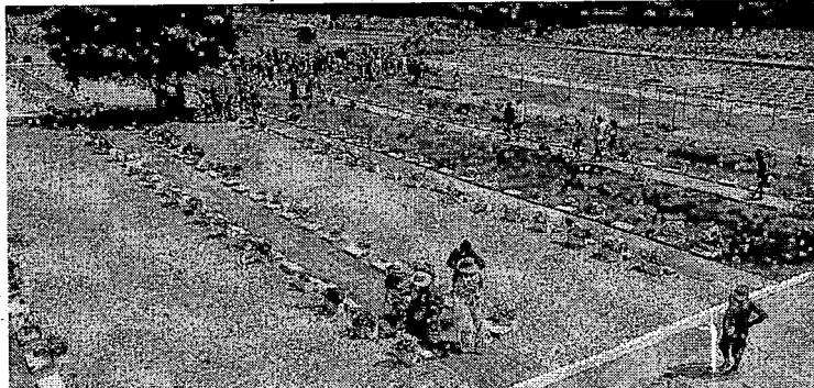
Vista aérea do Cemitério Jardim da Paz, na manhã de ontem diversas famílias foram ao local para homenagens a quem já partiu

Verificação de temperatura, disponibilidade de álcool gel e o uso das máscaras foram adotados nos cemitérios e o fluxo de pessoas começou desde cedo em dia de homenagens