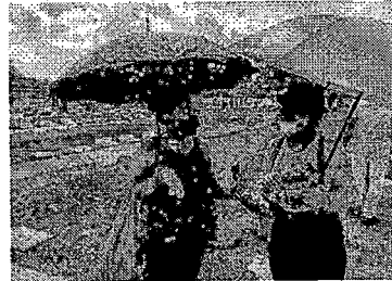
Grupo Luto Pela Vida fez uma ação para confortar as pessoas