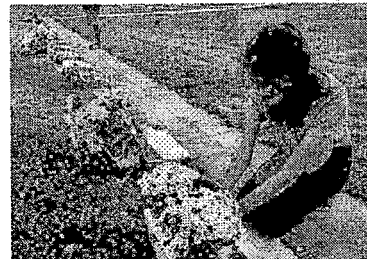
Famílias aproveitaram para orações e render homenagens