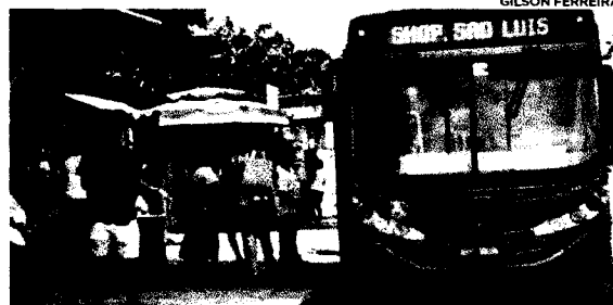
Usuários do transporte coletivo de São Luís terão que pagar tarifa mais cara a partir deste domingo