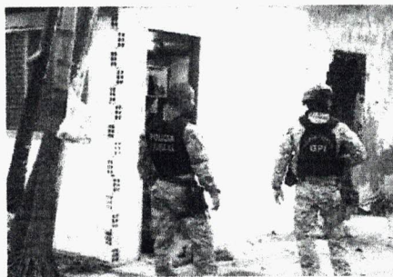
Policiais federais fazem incursões na Vila Conceição, durante a Operação Intramuros