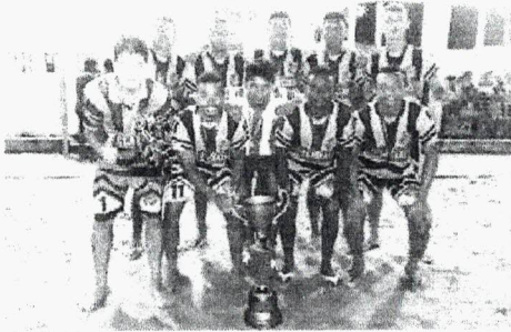
Os Glaciais, campeão da Copa Itaqui-Bacanga de Beach Soccer de 2018