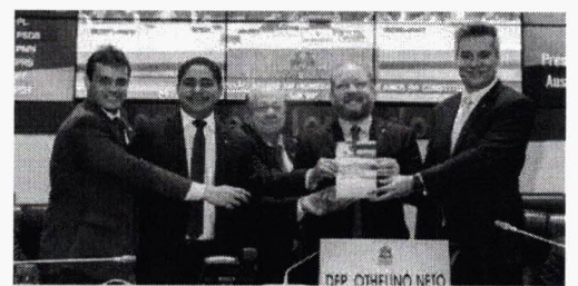
Deputados exibem nova edição da Constituição do Estado Anotada e Revisada