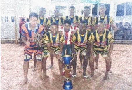
Os Glaciais, campeão da Copa Itaqui-Bacanga de Beach Soccer de 2018