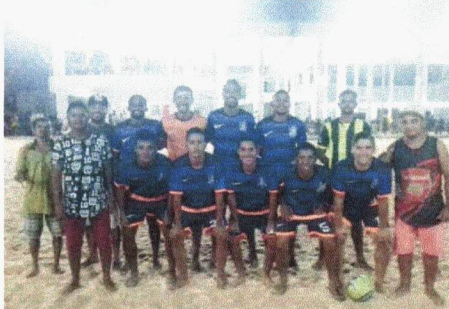
Rua Primavera, vice-campeão da Copa Itaqui-Bacanga de Beach Soccer de 2018