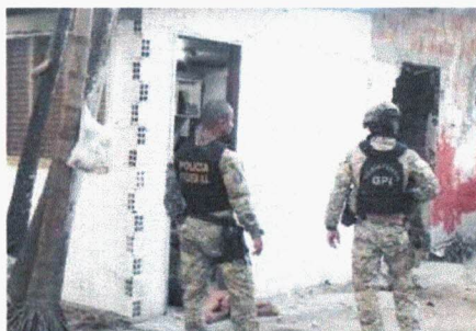
Policiais federais fazem incursões na Vila Conceição, durante a Operação Intramuros