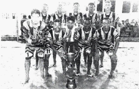
Os Glaciais, campeão da Copa Itaqui-Bacanga de Beach Soccer de 2018