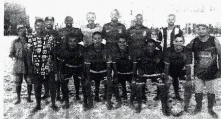
Rua Primavera, vice-campeão da Copa Itaqui-Bacanga de Beach Soccer de 2018

competição, os jogos vão começar na próxima sexta-feira (18), às 20h30. Dois jogos vão abrir a 11ª Copa Itaqui-Bacanga de Beach Soccer: Rua Primavera x Badbreux (20h) e Os Glaciais X Vila Dom Luis. Após as partidas o cantor Júnior Maranhão e Banda realizará um grande show. Todos os jogos serão disputados nas terças e sextas-feiras sempre a partir das 20h, na