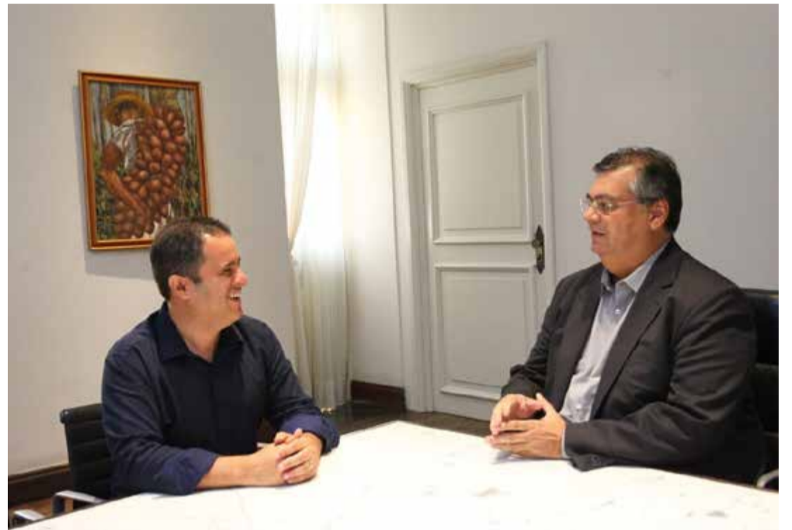
Flávio Dino e Edivaldo conversaram sobre os novos passos para São Luís

O governador Flávio Dino e prefeito de São Luís, Edivaldo, reuniram-se, no final da tarde de ontem (21), no Palácio dos Leões, e conversaram sobre obras, investimentos e ações na área de infraestrutura. “Trocamos informações sobre as obras que estão sendo realizadas pelo Governo do Estado e Prefeitura, e os novos passos a serem dados”, destacou Flávio Dino. PÁG. 4 (C1)