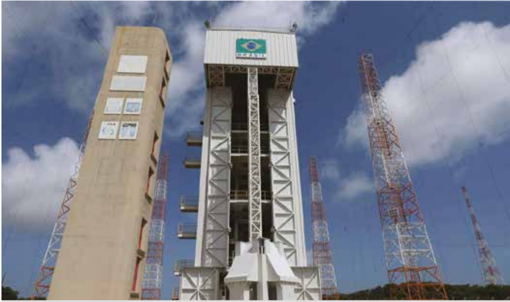
Acordo vai permitir uso da Base de Alcântara com tecnologia norte-americana

www.jornalpequeno.com.br | redacao@jornalpequeno.com.br