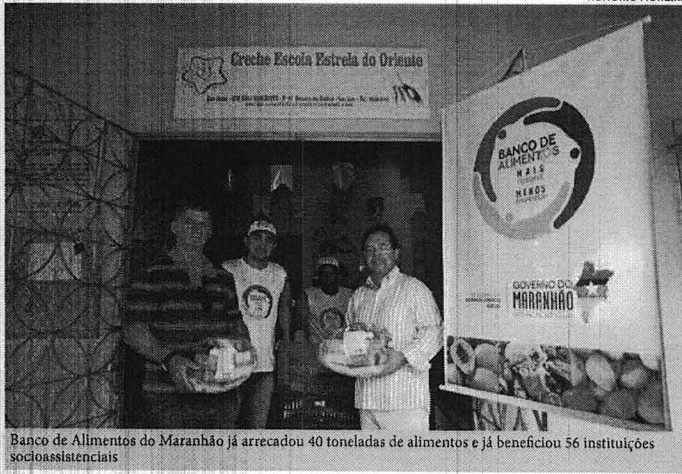
Banco de Alimentos do Maranhão já arrecadou 40 toneladas de alimentos e já beneficiou 56 instituições socioassistenciais

O Clube de Mães atende crianças e jovens de famílias carentes