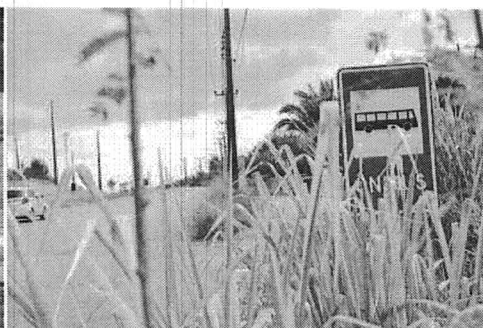
Outro problema enfrentado por quem trafega pela rodovia é o mato alto, que chega a encobrir a sinalização