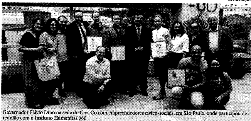
Governador Flávio Dino na sede do Civi-Co com empreendedores cívico-sociais, em São Paulo, onde participou de reunião com o Instituto Humanitas 360