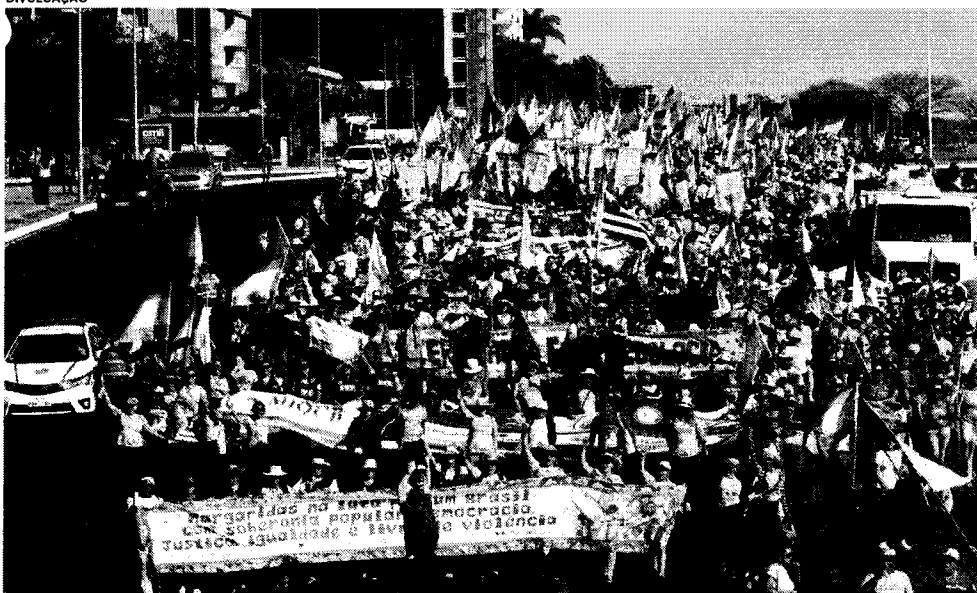
Entre os movimentos que representaram o Maranhão, na Marcha das Margaridas, está o das Quebradeiras de Coco Babaçu, que também levou mulheres do Pará, Piauí e Tocantins