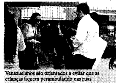
Venezuelanos são orientados a evitar que as crianças fiquem perambulando nas ruas