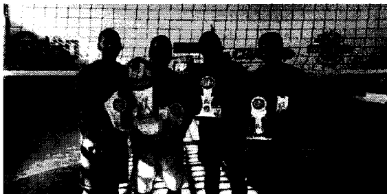
Equipe do Vôlei Brasil

A cidade de Rosário-MA, foi palco no domingo (11), do 1º tomieiro de Vôlei 4x4 masculino, competição que contou o apoio da Federação Maranhense de Voleibol (FMV). As disputas aconteceram no Ginásio Ferreirinha. O título da competição ficou com a equipe do Vôlei Brasil, que na decisão da competição enfrentou o Fênix Vôlei e venceu por 2 sets a 0, com parciais de 22x20 e 18x13. Na disputa de 3º e 4º lugar, a equipe do BGC enfrentou o Vingadores e venceu por 21x19. Nesta edição participaram seis equipes. Fênix Vôlei, BGC, Kayros Vôlei, Vingadores, Vôlei Brasil e Vôlei Juventus. A equipe vencedora do tomieiro, foi premiada com R$ 500, a segunda colocada com R$ 200 e a terceira R$ 100. As equipes receberam troféu e medalhas.