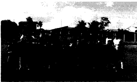
Operário estreou com vitória

As disputas do Futebol Adulto Masculino voltam a movimentar o Estádio Municipal Santo Figueredo no próximo fim de semana. No sábado (17), às 15h45, tem o confronto entre Xeleleu e Morada Nova pelo Grupo C. Já no domingo (18), o Mearim encara o E.C. Arari pelo Grupo B.