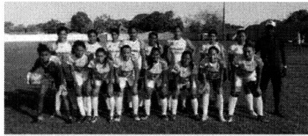
Campeonato Maranhense Feminino vai movimentar Região do Alto Turi

de cada grupo - em jogos de ida e volta. Classificam-se as duas primeiras dos grupos que fazem as semifinais, também em dois confrontos. As vencedoras fazem a final. A competição inicia no sábado (29), com Centro Novo e Governador Nunes Freire. No domingo (30), Maranhãozinho e Nova Olinda fecham a primeira rodada. A final está prevista para 31 de agosto. A campeã e vice garantem vagas para a etapa de São Luís, com data a ser definida.