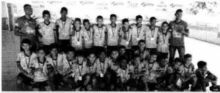
Escolinha Gol de Placa

Um fim de semana bastante diferente para dezenas de crianças que praticam futebol de campo na cidade de Bacabal. No último sábado (22), o campo da Associação dos Profissionais da Saúde de Bacabal (APSB) foi palco da primeira edição do Campeonato Interno da Escolinha Gol de Placa. O evento faz parte das atividades do projeto "Escolinha Gol de Placa", iniciativa desenvolvida por meio da Lei de Incentivo ao Esporte e que conta com o patrocínio do governo do Estado da Distribuidora Medeiros. Mais do que ser apenas um evento esportivo, o torneio teve caráter social e reuniu meninos de três escolinhas de futebol: Gol de Placa, Verona e Santos. A manhã de competição foi um verdadeiro sucesso. A garotada se divertiu bastante em campo. Apesar da pouca idade, os meninos deram um show para a alegria dos pais, que fizeram questão de acompanhar os filhos. No fim, melhor para a equipe do Verona que conquistou o título do Campeonato Interno da Escolinha Gol de Placa ao vencer todos os jogos.