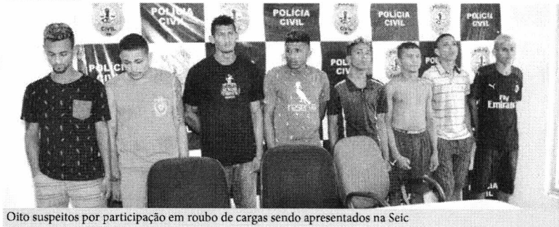
Oito suspeitos por participação em roubo de cargas sendo apresentados na Seic