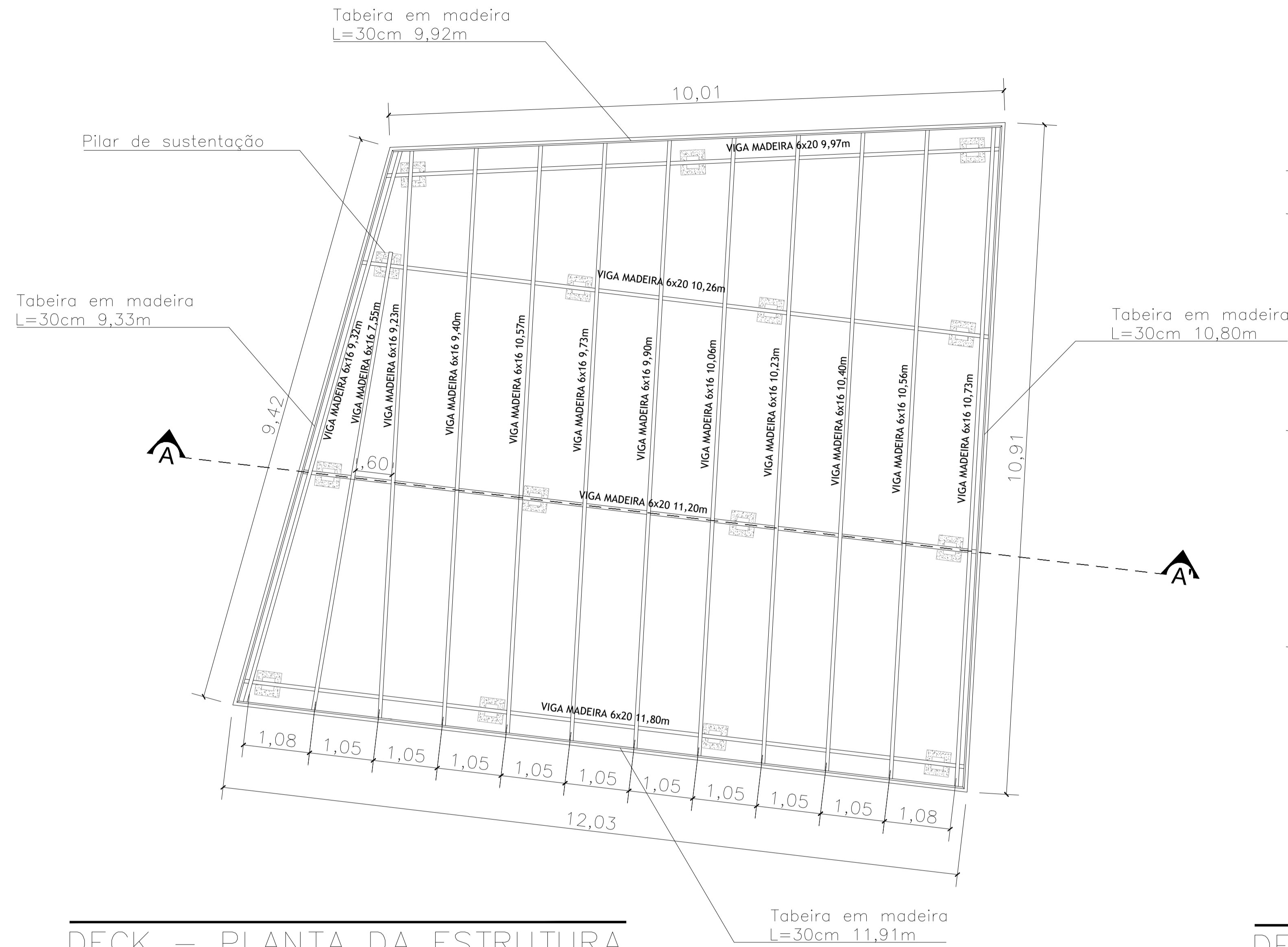
DECK – PLANTA DA ESTRUTURA ESC. 1:50