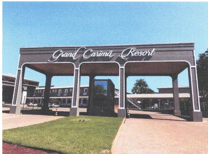
Grand Carimã Resort & Convention Center